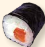
MAKI SAUMON FROMAGE